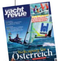
Cover: 49er-Artisten Nico Delle-Karth und Niko Resch